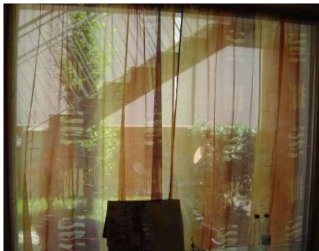
Escalier du voisin du dessus débutant dans le jardin du voisin du dessous et passant devant sa fenêtre.

Disposer d'un espace extérieur « en soi » ne suffit pas. Comme nous l'avons vu, quand un espace extérieur est associé au logement et qu'un certain nombre d'aspects n'en permettent