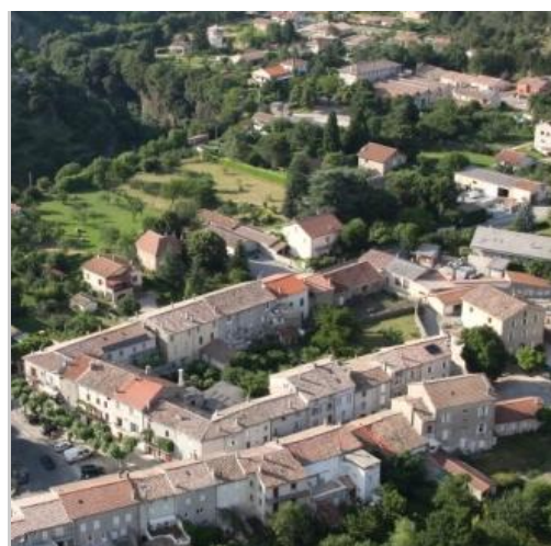
Quel urbanisme demain dans un village ardéchois ?