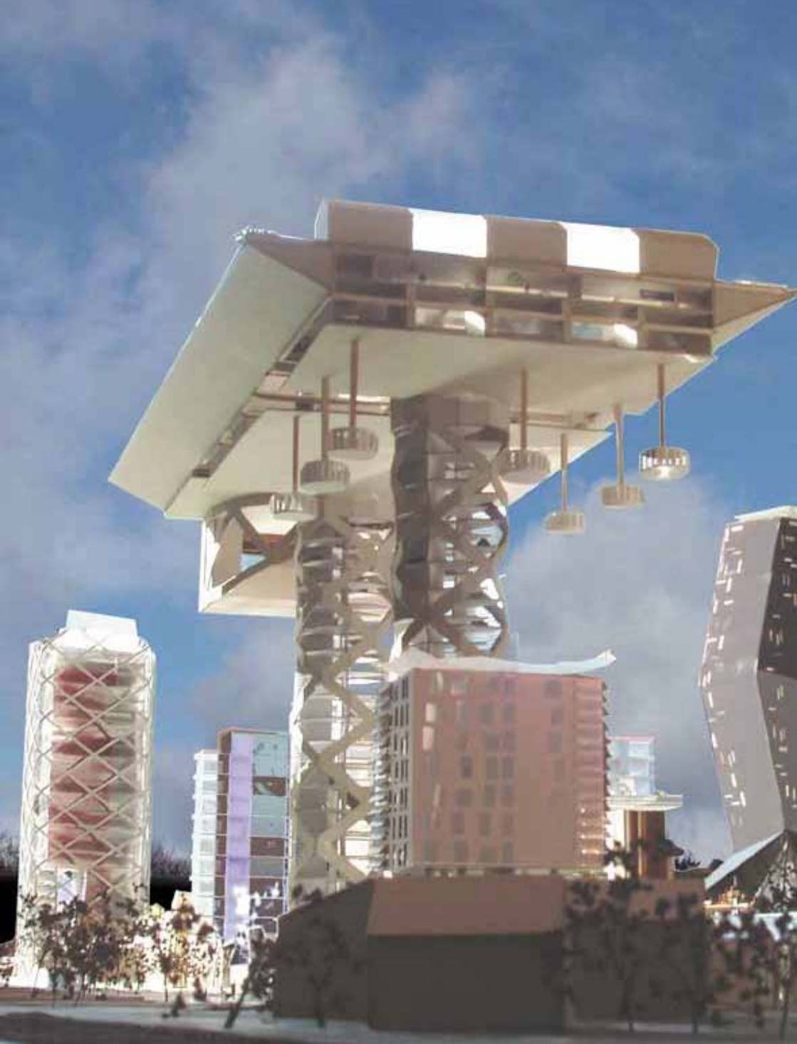
Autonomies partagées - Manufacture des allumettes - Trélazé (49) Projet collectif - Atelier Utopies - 5 ème année ENSAB Rennes 2008