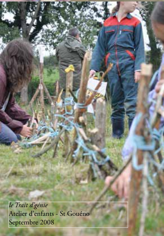
le Trait d'génie Atelier d'enfants - St Gouéno Septembre 2008