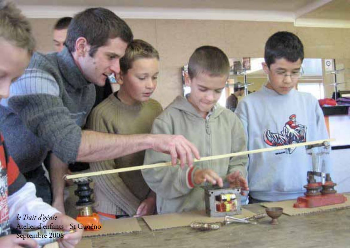
le Trait d'génie Atelier d'enfants - St Guoéno Septembre 2008