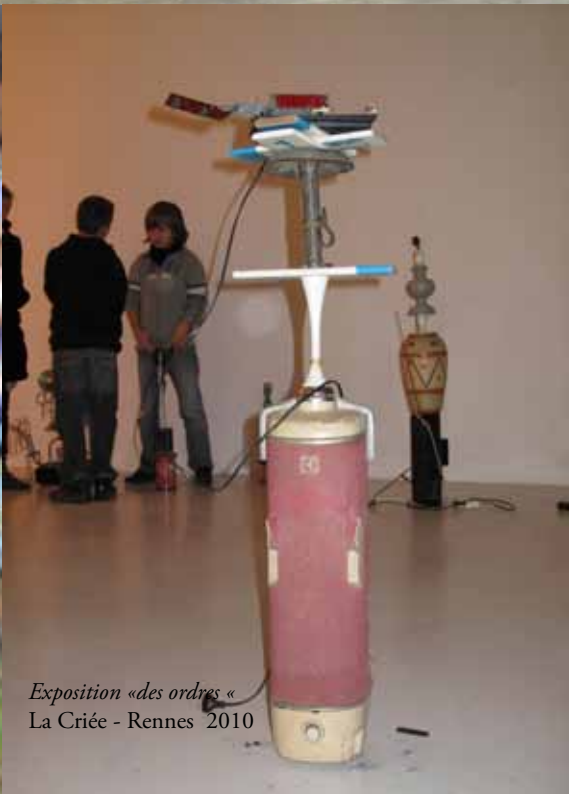
Exposition «des ordres» La Criée - Rennes 2010