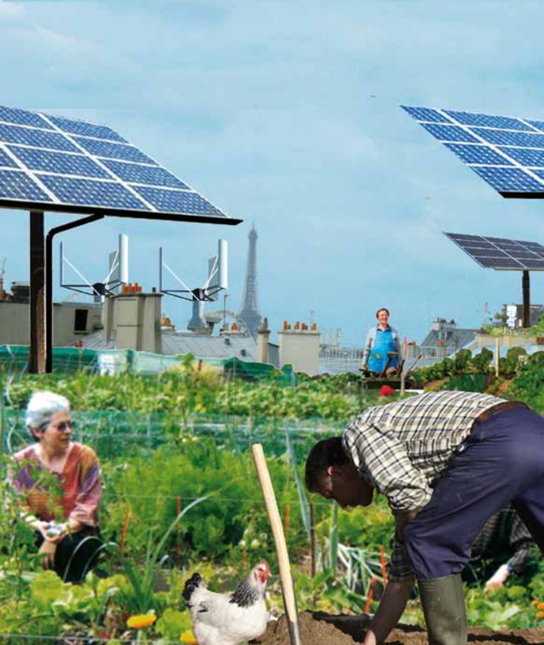
Maraichage + petit élevage - 3000 m 2 à R + 9 - Paris 15 ème - 5 emplois CDI + formation