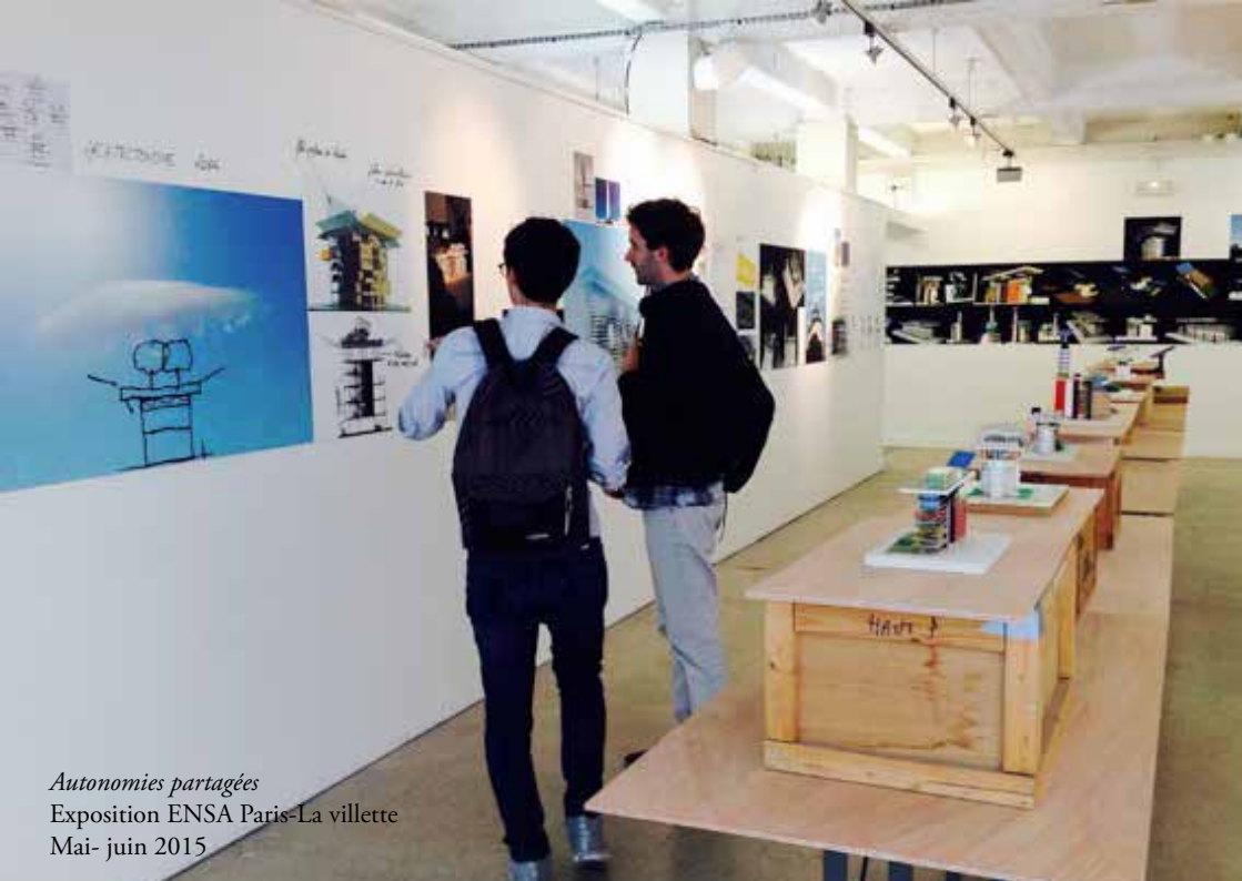
Autonomies partagées Exposition ENSA Paris-La Villette Mai- juin 2015