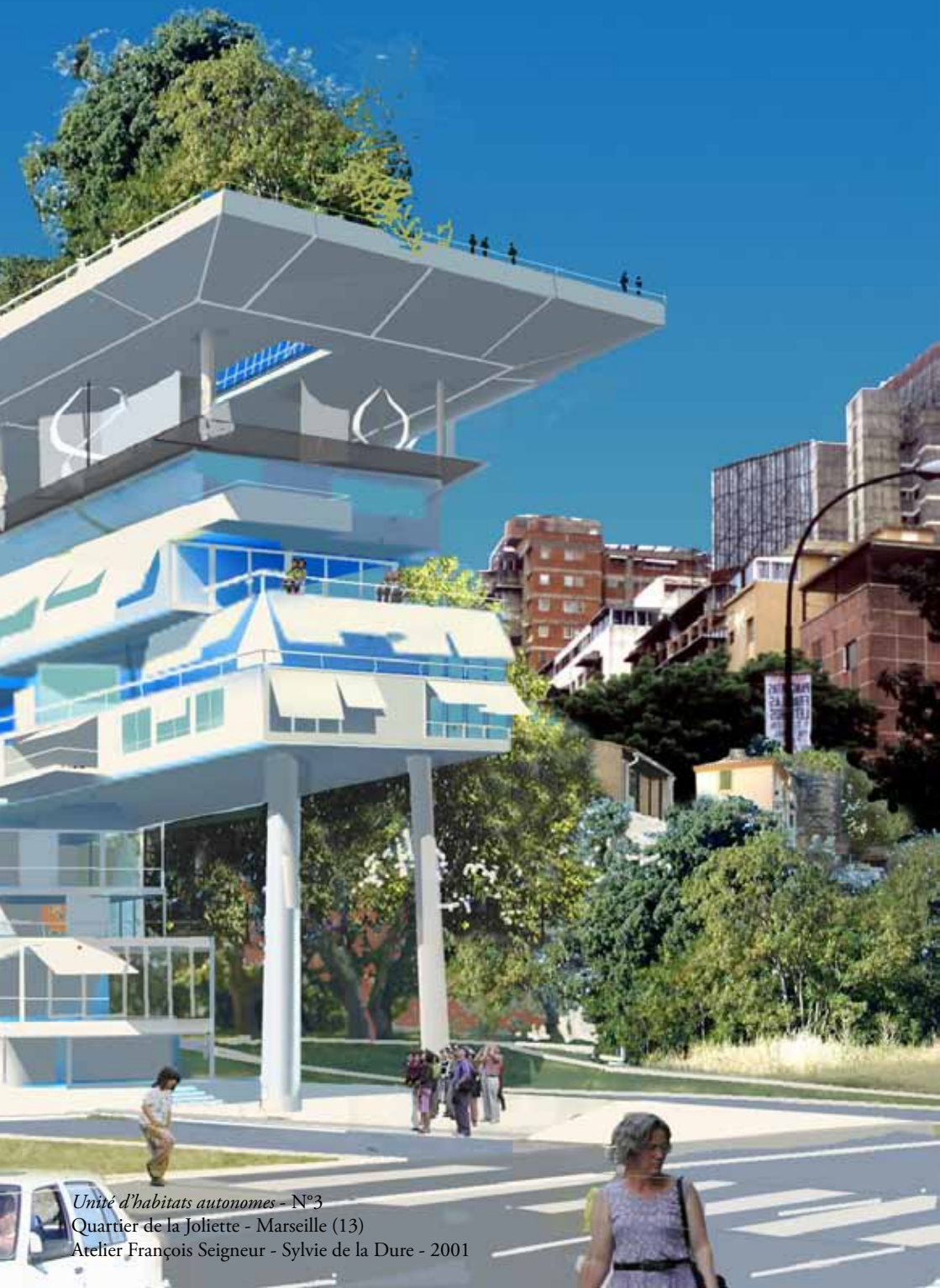
Unité d'habitats autonomes - N°3 Quartier de la Joliette - Marseille (13) Atelier François Seigneur - Sylvie de la Dure - 2001