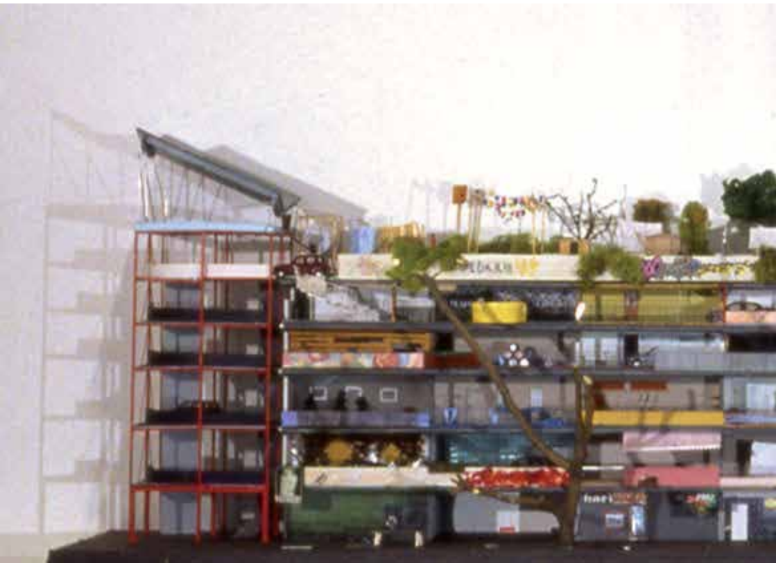
Unité d'habitations autonomes - Denain (59) Atelier François Seigneur - Sylvie de la Dure, 1995 Maquette réalisée par les étudiants de l'ENSATT