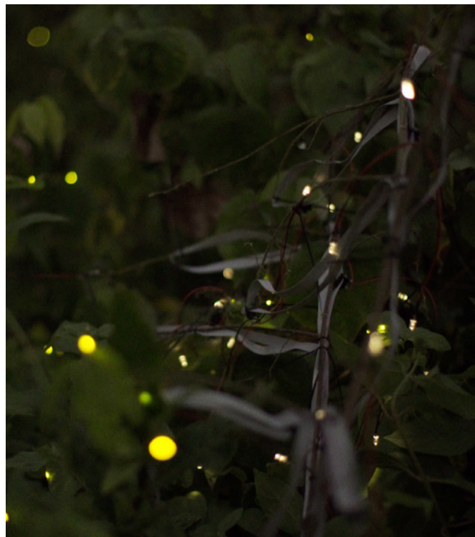
Synchronicity (Thailand), video still.

As an artist and composer, Robin Meier explores the emergence of natural and artificial intelligence and the role of humans in a world of machines. He tries to make sense of these questions through musical compositions and installations. Referred to as "Artist of the future" (le Monde), "Maestro of the swarm" (Nature) or simply "pathetic" (Vimeo) his work has been shown in institutions including Palais de Tokyo, Paris, Fondation Ricard in Paris, Paris Museum of Modern Art, the 11th Shanghai Biennale, Art Basel, Arsenal Contemporary NYC or the Edythe and Eli Broad Museum MSU. Robin is also a collaborator at the Music Research Institute IRCAM/ Centre Pompidou (Paris) since 2006 and currently a fellow at the Istituto Svizzero di Roma.