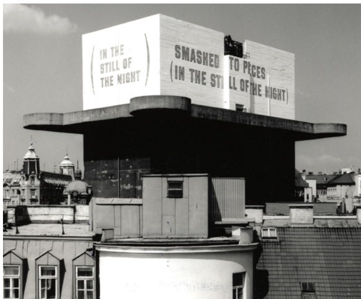
Topographie I, Wiener Festwochen, Vienna, 1991

© 2019 Lawrence Weiner / ADAGP, France Private Collection