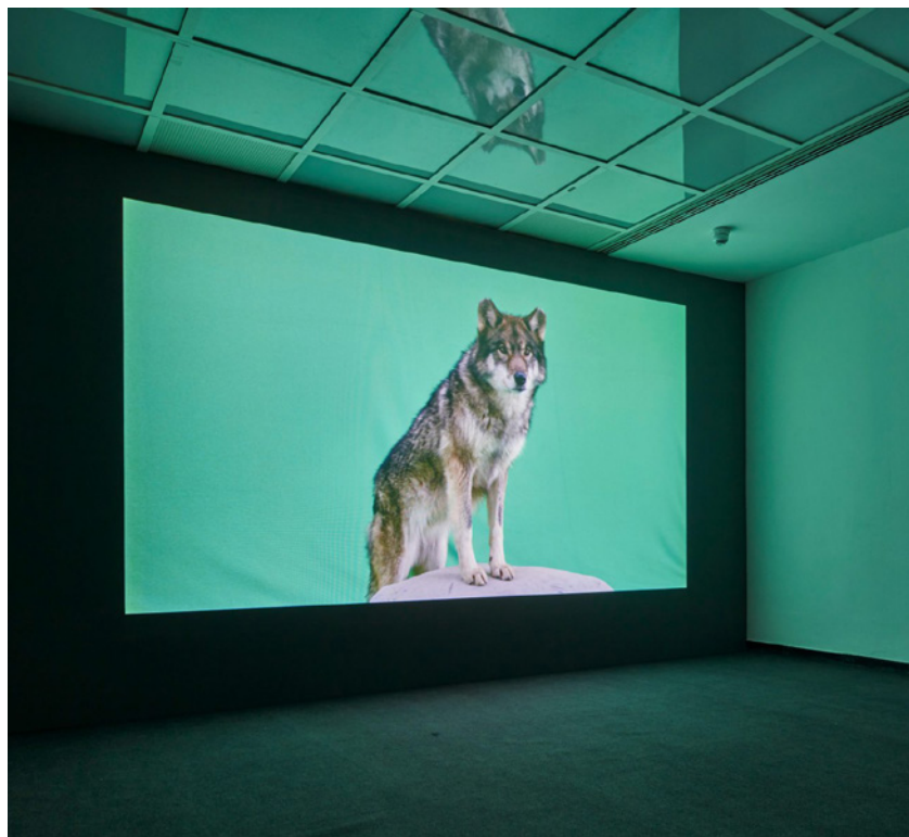
Standing Still, 2019. Installation view Frankfurter Kunstverein