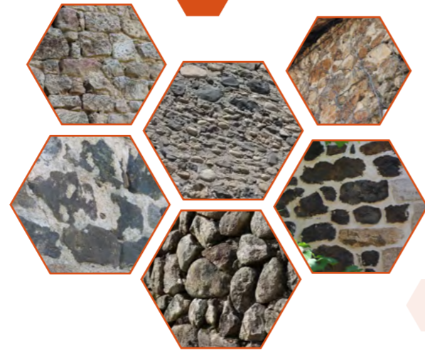
Palette de couleurs naturelles existantes (roches/pierres) sur le territoire de la Communauté de communes Ardèche des Sources et Volcans.

Le territoire de la Communauté de Communes Ardèche des Sources et Volcans présente plusieurs entités géologiques offrant ainsi une palette naturelle de couleurs diversifiée selon les secteurs. Ceci génère ainsi des ambiances de couleurs différentes et des identités paysagères spécifiques selon les villages du territoire.