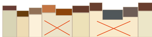
Séquence 1 : à éviter plusieurs façades mitoyennes sont de couleur identiques.

la couleur : l'ensoleillement. En effet, en fonction de la largeur de la rue et de son orientation, la présence de la lumière variera et l'aspect de la couleur aussi.